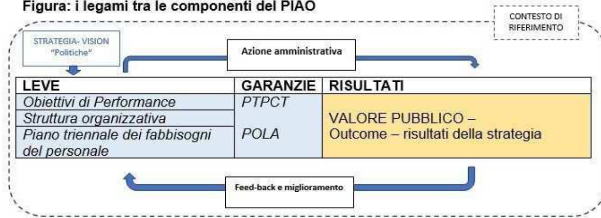
Figura: i legami tra le componenti del PIAO